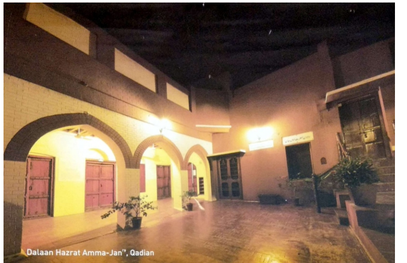
Dalaan Hazrat Amma-Jan, Qadian

“துஆக்கள் தொடர்பாக ஹஸ்ரத் வாக்களிக்கப்பட்ட மஸ்ஹீ (அலை) அவர்களிடம் இருந்த ஒரு சிறப்புத்தன்மை என்னவெனில், ஹுஸூர் (அலை) அவர்கள் பயணத்தில் இருந்த நிலையிலும், பயணத்தில் இல்லாத நிலையிலும் துஆவுக்காக ஒரு தனிப்பட்ட இடத்தை உருவாக்கிக் கொண்டிருந்தார்கள். மேலும் அது ‘பைத்துத் துஆ’ என்று அழைக்கப்பட்டு வந்தது. நான் ஹுஸூர் (அலை) அவர்களுடன் எங்கெல்லாம் சென்றேனோ, அவர்கள் துஆவுக்காக ஒரு தனி இடத்தைக் கண்டிப்பாக உருவாக்கியதை நான் கண்டிருக்கிறேன். மேலும் ஹுஸூர் (அலை) அவர்கள் துஆவுக்காக ஒரு தனி இடத்தைக் கண்டிப்பாக உருவாக்கிக் கொண்டார்கள். மேலும் அவர்கள் தமது அன்றாட நிகழ்வில் ஒரு நேரத்தை துஆவுக்காக தனித்து வைத்து விடுவதை எப்போதும் வழக்கமாகக் கொண்டிருந்தார்கள். காதியானில் துவக்க காலத்தில் ஹுஸூர் (அலை) அவர்கள், தமக்குத் தங்குவதற்காக குறிப்பாக ஒதுக்கப்பட்டிருந்த தமது அந்த அறையிலேயே துஆக்களில் ஈடுபட்டு வந்தார்கள். அது அவர்களுக்காக தனிப்பட்ட இடமாக இருந்தது.