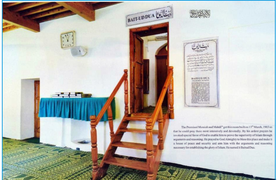
The Promised Messiah and Mahdi got this room built on 13 th March, 1903 so that he could pray there most intensively and devotedly. By his ardent prayers he invoked special favor of God to enable him to prove the superiority of Islam through arguments and reasoning. He prayed to God Almighty to bless this place and make it a house of peace and security and arm him with the arguments and reasoning necessary for establishing the glory of Islam. He named it Bait-ud-Dua.

நாம் பைத்துத் துஆவில் துஆ செய்யும் நேரத்தில் ஹஸ்ரத் வாக்களிக்கப்பட்ட மஸ்ஹர் (அலை) அவர்கள் இதை கட்டும்போது குறிப்பிட்டிருந்த அந்தக் குறிக்கோளை நாம் கவனத்தில் வைத்துக் கொள்ள வேண்டும். முதன் முதலில், இஸ்லாம் அஹ்மதிய்யத்தின் வெற்றிக்காக வேதனையுடன் கூடிய உள்ளத்துடனும், மன்றாடுதலுடனும் துஆக்கள் செய்ய வேண்டும். குறிப்பாக, அல்லாஹ்வே! ஹஸ்ரத் வாக்களிக்கப்பட்ட மஸ்ஹர் (அலை) அவர்கள் இந்த அறையில் எத்தனை துஆக்கள் செய்துள்ளார்களோ அவற்றை நீ ஏற்றுக் கொண்டவாறு அதன் கனிகளை ஜமாஅத்திற்கும், முழு உலகிலுள்ள மக்களுக்கும் அருள் புரிந்து கொண்டே